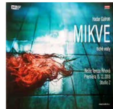
ZLIN - תאטרון עירוני זלין, צ'כיה