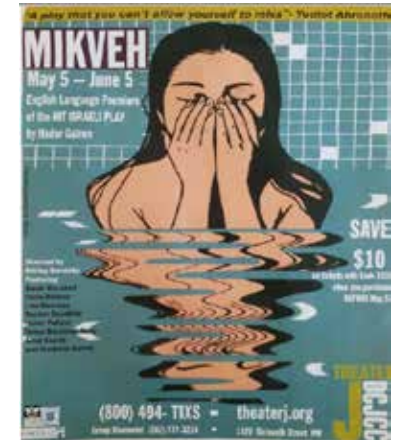
THEATRE J - וושינגטון