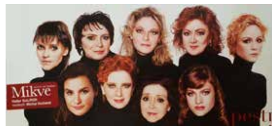
VOG - בודפשט, הונגריה