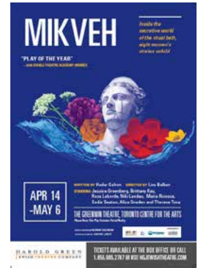
THE GREENWIN THEATRE - טורונטו