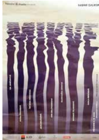
NARODNI DIVADLO - תיאטרון לאומי פראג