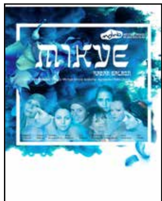
MLADA BOLESLAV - תיאטרון עירוני מלאדה בולסלאב, צ'כיה