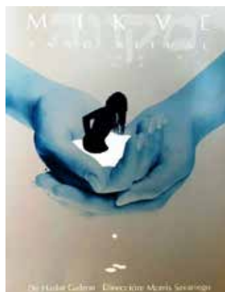
NATIONAL THEATRE MEXICO - תאטרון עירוני מקסיקו